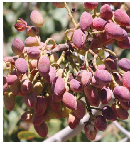
شکل ۲- میوه های رسیده پسته رضایی زودرس در تاریخ ۳ مرداد ۱۳۹۵

نتایج حاصل از آنالیز مغز این رقم حاکی از این است که پروتئین آن در حدود ۴