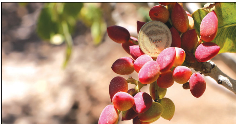
شکل ۳- رقم بادامی زودرس

رقم رضایی زودرس زیاد شناخته شده نیست و شاید بدست بزرگان پسته می افتاد بیشتر تکثیر می شد و جزو رقم های تجاری به حساب می آمد. هنوز جای کار زیادی دارد و گزینه خوبی برای حل مشکلات کشاورزان پسته کاری است. امسال کشت بافت این رقم نیز در دست اقدام است و مقاومت پایه به تنهایی بررسی خواهد شد.