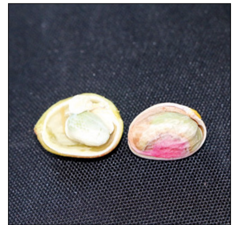
شکل ۱ - مقایسه میزان رسیدگی رقم رضایی زودرس در سمت راست با رقم کله قوچی در سمت چپ

این رقم بصورت ترخوری به بازارهای تهران، اصفهان و شیراز و حتی به دبی فروخته شده است. در بازار هرکیلوگرم