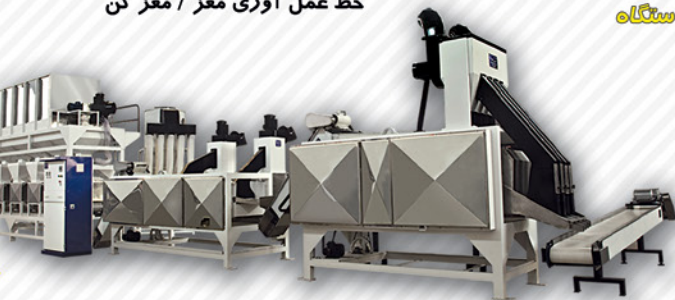
پلاتترین راندمان در خروجی دستگاه تضمین ماست