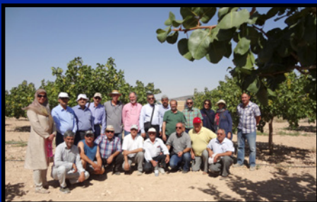
تور کشاورزی کشور اسپانیا صفحه ۱۳