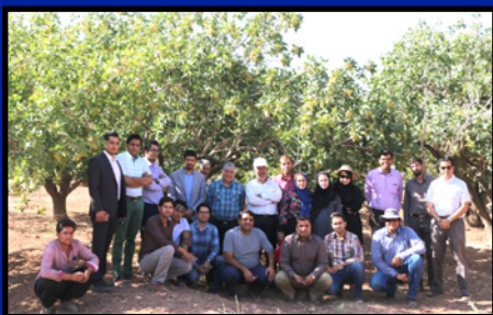
تور بازدید از نتایج هرس سربرداری و جوانسازی صفحه ۱۱