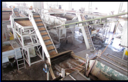
پیش بینی افزایش دوازده و نیم درصدی هزینه های ضبط پسته صفحه ۵