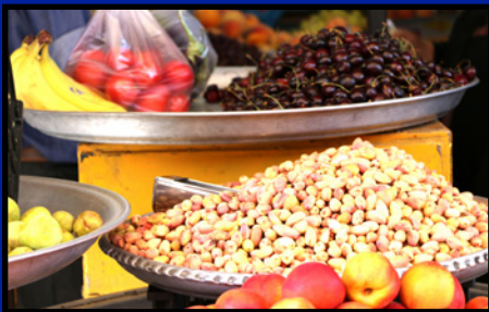
پسته نوبرانه شهرستان مه ولات صفحه ۱۲