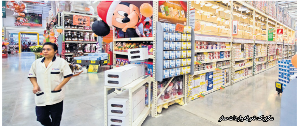
مکزیک: شرکت واردات صفر