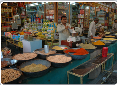
بازار هند: تعرفه بالا

هر چند اکنون صنعت پسته آمریکا عملاً متکی بر صادرات است، اما بازار پسته آمریکا بعد از چین بزرگترین مصرف کننده پسته جهان محسوب می شود.