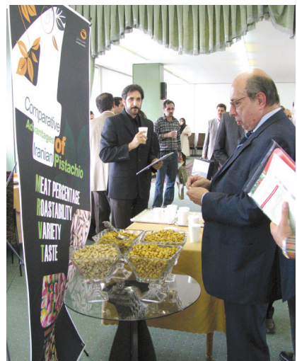
رئیس اتاق بازرگانی پرتغال

در ادامه نشست، و در مذاکره با اعضای هیأت پرتغالی، کاتالوگ و بروشورهای انجمن، توزیع شد و میهمانان با پسته ایرانی پذیرایی شدند.