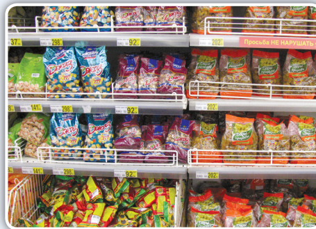
روسیه: حاکمیت سوپر مارکت‌های مقتدر