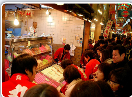
ژاپن و کره: قدرت تشخیص ذائقه مردم