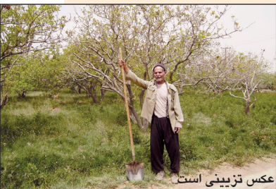
عکس تزئینی است

* خدا رحمت کند پدرم را. از رشد و قد کشیدن درخت هایی که بادیست خود بذیشان را کاشته بود، شاد می شد و لذت می برد، و از تشنگی، سرمازدگی و آفت زدگی شان رنج می کشید. هر تک درخت پسته را چون فرزند خود عزیز می داشت. زیبایی احساس او وقتی با درختان پسته حرف می زد و نوازششان می کرد، در وجودم چنان ریشه دوانده که درخت پسته را چون آشنای عهد کودکی عزیز می دارم. نمی دانم این ارتباط زیبا میان انسان و گیاه را چقدر باور دارید، اما رمز و رازهای داستان خلقت در این باره بسیار است. همخوانی زادگاه و محیط زیست انسان و گیاه؛ نور و آب و خاک را باید از منظر هستی و حیات با چشم دل دید. از پس آن سالها همیشه از خود پرسیدم این سرمایه انسانی که در پای درخت پسته عمر و جوانی خود را می گذارد و سرشار از احساس وابستگی و تعلق بدان است، در محاسبات هزینه های تولید آیا به حساب آورده ایم؟ مدیران صنعت پسته به این سرمایه عظیم انسانی چگونه می نگرند؟ از یاد نبریم که حضور پربرکت بیش از ۷۰ هزار کشاورز پسته کار، سرمایه بزرگ