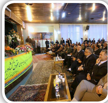
سومین کنگره سراسری خانه کشاورز ۳