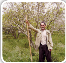
انسان و درخت ۴