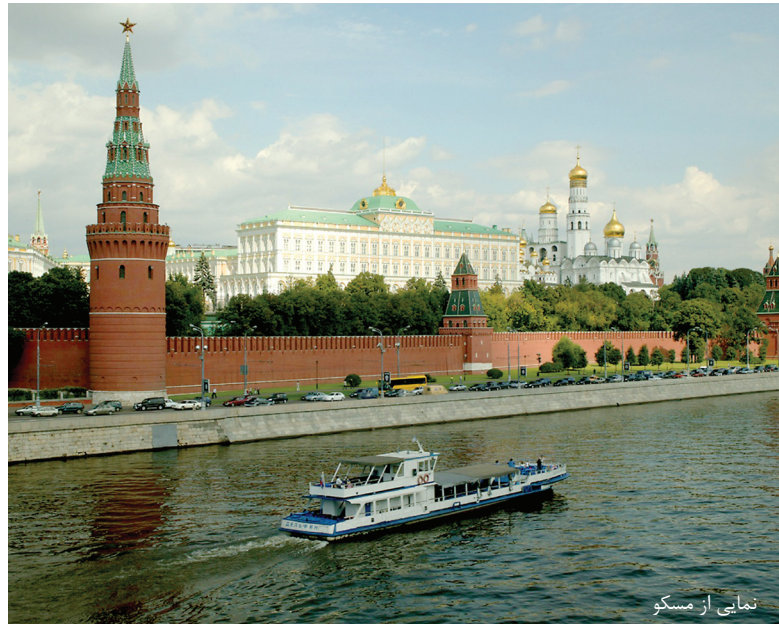
نمایی از مسکو

PRODEXPO 17th International Exhibition of Food, Beverages and Food Raw Materials February 8-12 2010