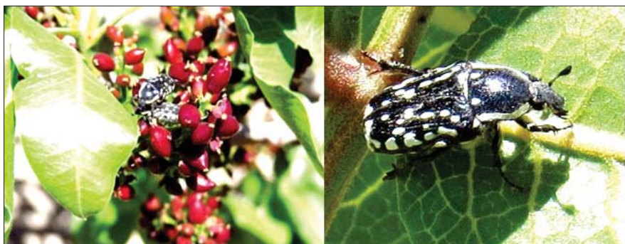
شکل ۱ و ۲- حشره کامل سوسک گرده خوار سیاه بر روی برگ و خوشه پسته

در تاریخ ۲۹ فروردین ۱۳۹۵ از باغ های پسته منطقه شمال غربی شهرستان انار در چاه تلمبه حجت آباد غرب (۱۰ کیلومتری مرکز شهرستان) بازدید بعمل آمد. در این بازدید تعداد زیادی از حشرات کامل سوسک گرده خوار سیاه در حال تغذیه از برگ و میوه های تازه تشکیل شده درختان پسته رقم اکبری مشاهده شد (شکل های ۱، ۲، ۳ و ۴).