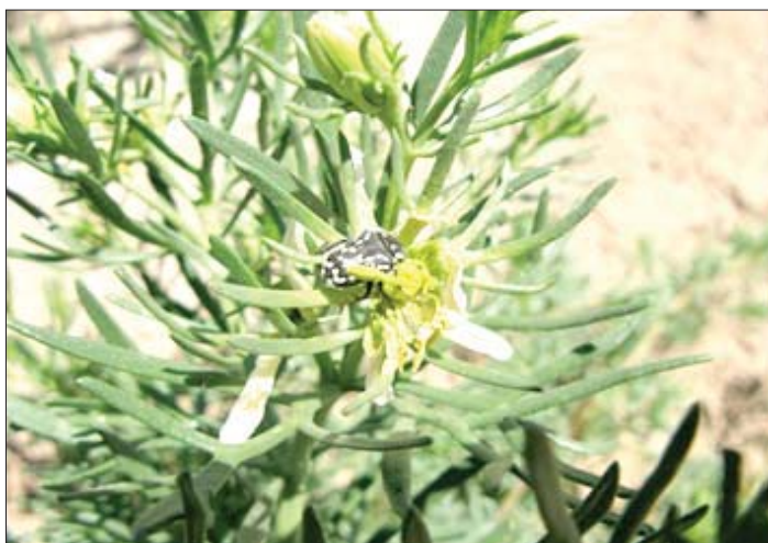
شکل ۶- سوسک گرده خوار سیاه روی اسفند

تاکنون تغذیه این گونه سوسک از گرده و سایر قسمت های گل و گاهی حتی جوانه های گل گیاهان زراعی، باغی و علف های هرز در باغ های پسته گزارش شده است. هر ساله در اوایل فصل بهار تغذیه تعداد کمی از حشرات کامل روی گل های نر و ماده درختان پسته مشاهده شده است. این اولین باری است که افزایش تراکم جمعیت این حشره در باغ های پسته و تغییر ذائقه و رفتار تغذیه ای آن مشاهده می شود که نشان می دهد علاوه بر تغذیه از گل و گرده گل، از میوه های تازه تشکیل شده و نابالغ و از حاشیه برگ های درختان پسته نیز قادر به تغذیه می باشد. این حشرات قادرند از برگ و