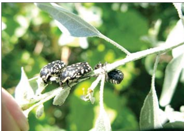
شکل ۸- سوسک گرده خوار سیاه روی سنجد