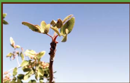
تشخیص و رفع کمبود روی و مس درختان پسته در اوایل فصل صفحه ۵