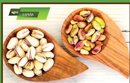
پتانسیل کاشت پسته در اسپانیا صفحه ۷