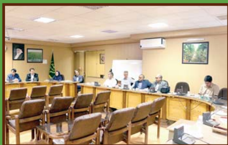
تغذیه درخت پسته باید در بلندمدت رصد شود صفحه ۴