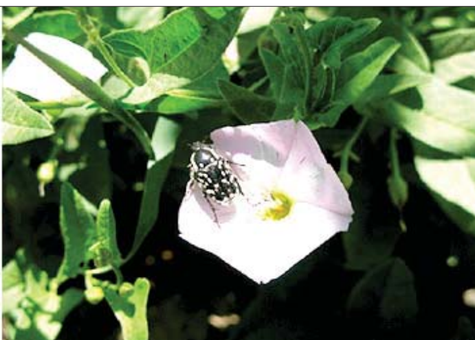
شکل ۷- سوسک گرده خوار سیاه روی پیچک صحرائی