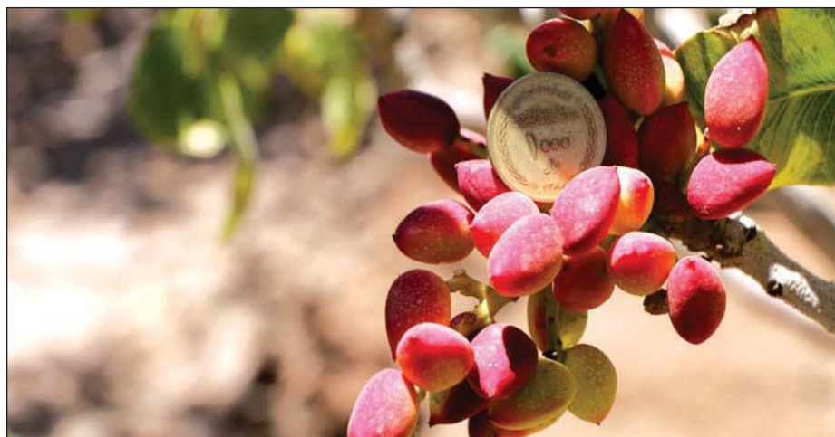
شکل ۳- رقم بادامی زودرس

رقم رضایی زودرس زیاد شناخته شده نیست و شاید بدست بزرگان پسته می افتاد بیشتر تکثیر می شد و جزو رقم های تجاری به حساب می آمد. هنوز جای کار زیادی دارد و گزینه خوبی برای حل مشکلات کشاورزان پسته کاری است. امسال کشت بافت این رقم نیز در دست اقدام است و مقاومت پایه به تنهایی بررسی خواهد شد.