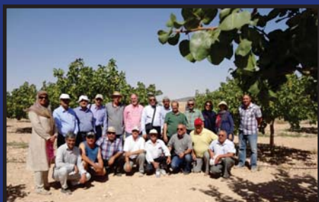
تور کشاورزی کشور اسپانیا صفحه ۱۳

این رقم در مناطقی از جمله رفسنجان، ورامین، قزوین، اردستان استان اصفهان و تبریز پیوند زده شده است. در ابتدا دلیل تکثیر پیوند این رقم، مطالعه بر روی خصوصیات آن از جمله مقاومت به آفات، اندازه میوه و وضعیت باردهی و زودرسی آن بوده است. شایان ذکر است که این رقم از نظر خصوصیات کمی و کیفی در ردیف ارقام تجاری است؛ به طوری که در سال هایی که وضعیت تغذیه و آب خوب بوده انس آن ۲۲ تا ۲۴ و سال های کم تغذیه و کم آب، انس به ۲۴ تا ۲۵ رسیده است. از نظر اندازه، از فندق درشت تر و تقریباً بین فندق و کله قوچی است (شکل ۱). خندانی و خوشه بندی خوبی دارد و در مناطقی که شرایط آبی مساعدتری داشته اند، رشد تاج درخت دو برابر شده است.