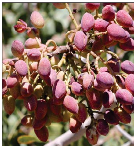
شکل ۲- میوه های رسیده پسته رضایی زودرس در تاریخ ۳ مرداد ۱۳۹۵

نتایج حاصل از آنالیز مغز این رقم حاکی از این است که پروتئین آن در حدود ۴