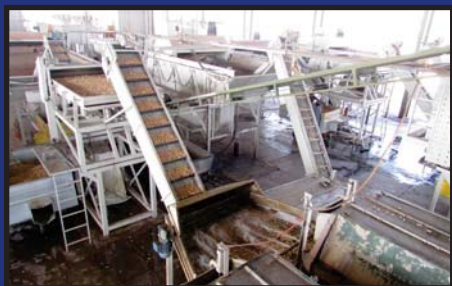
پیش بینی افزایش دوازده و نیم درصدی هزینه های ضبط پسته صفحه ۵