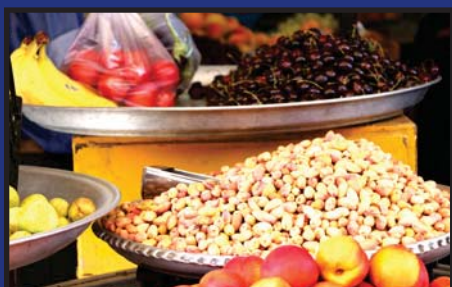
پسته نوبرانه شهرستان مه ولات صفحه ۱۲