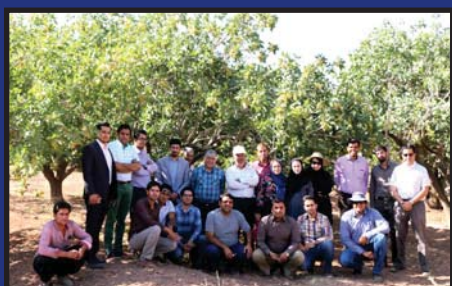
تور بازدید از نتایج هرس سربرداری و جوانسازی صفحه ۱۱